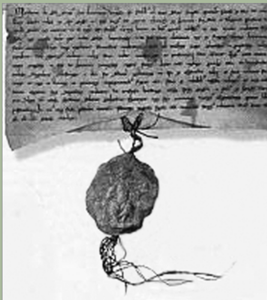
Lietuvos karaliaus Mindaugo aktas (1253 m. spaldis). Dokumentą patvirtina vienintelis žinomas karaliaus Mindaugo antspaudas.

Bet grįžkime į Mindaugo laikus. Lietuvos valstybės vienijimas vyko tuo metu, kai aplinkiniai baltai atkakliai grūmėsi su atsibasčiusiais ir čia įsitvirtinusiems vokiečiams. Kaimynų baltų beveik šimtmetį trukusi kova (šiaurėje 1202–1290 m., Prūsijoje 1230–1274 m.) leido Lietuvai laimėti laiko ir netrukdomai stabilizuoti politinę suirutę, netikėtai susidariusią XIII a. antroje pusėje po Mindaugo mirties. Kryžiuočių karai su Lietuva apogėjų pasiekė daug vėliau, Gedimino ir ypač Kęstučio laikais, kada kryžiuočiai sinchronizuodavo savo puolimus iš Prūsijos ir Livonijos pusių.