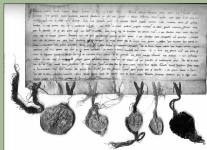
Žiemgalos Rytų ir Vakarų žemių dalybų aktai

rio, aktas ir 5) 1416 m. rugpjūčio 23 d. Vokiečių ordino Livonijos magistras Ordino prokuratoriui nurodo, kokias nuolaidas galima padaryti Rygos arkivyskupui, kad būtų pasiektas susitarimas. Iš leidinyje paskelbtų penkių aktų mūsų dienas pasiekė tik keturi – jie saugomi Rygos, Krokuvos, Varšuvos ir Berlyno archyvuose. Penktasis dokumentas – 1259 m. popiežiaus bulė – neišliko. Ji sudegė dar XIX a. Sankt Peterburge.